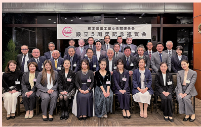
設立5周年記念祝賀会

私たち熊本県女性部連合会は略名をエレ女とし、設立当初より、さまざまな活動をしてきました。毎年、低学年を対象としたイベントを企画し、子どもたちにモノづくりの楽しさを体験してもらい、この業界をもっと身近に感じてもらえるよう工夫してきました。子どもたちの反応はとても新鮮で、LEDライトが完成した際に「わあ！光った！」と声を上げて喜ぶ姿や、真剣な顔で配線し組み立てようと頑張る姿、腰道具を装着する「かっこいいー」と言ったり、ハンマーやドライバーで工事のまねをする様子、このような体験をとおして、子どもたちが「電気ってすごい」「自分もやってみたい」と思えるきっかけになれば、という